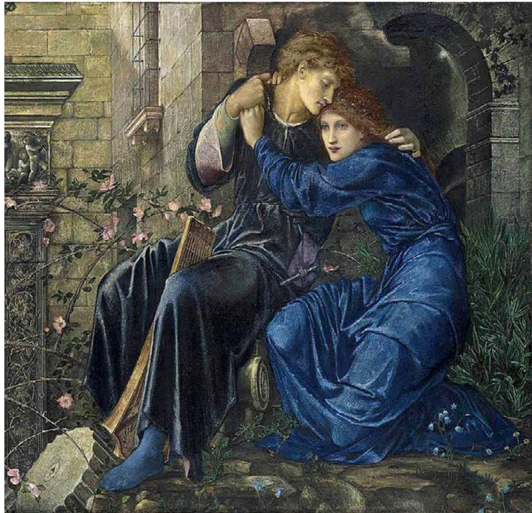
EDWARD BURNE-JONES, LOVE AMONG THE RUINS