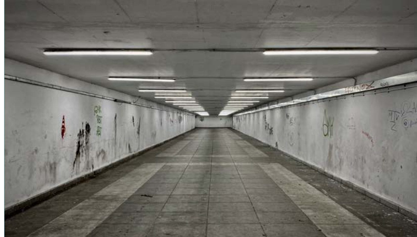
ȘTEFAN SUSANU, TUNELUL TIMPULUI PIERDUT

Dincolo de probleme lingvistice, rămâne mesajul. Textul lui Negruzzi este unul dintre cele mai rezistente texte ale literaturii noastre. Să lupți, chiar și atunci când știi că sunt mari șanse să fii învins e o învățătură rară. Noi, ca popor, știm, din timpuri vechi, că sabia nu taie capul ce se pleacă. Cât despre „Frații Jderi”, spun doar că am întâlnit elevi de